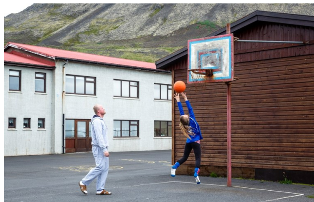
Isländsk far och dotter spelar basketboll.